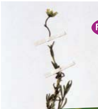
← Minuartie dressé , herbier de Genève (M. André)

Cette gracieuse petite plante des tourbières, qui ne se rencontrait que dans le massif jurassien en France, n'a plus été observée dans la région depuis 1958. Il semble qu'elle ait souffert de l'effet conjoint de la destruction de ses biotopes et des prélèvements des collectionneurs.