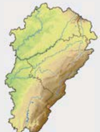
← Crépide rongée (F. Dehondt) Présence par commune (en rouge, après 2000, en bleu, avant) →

Cette plante présente une aire d'occupation très restreinte en Franche-Comté. Elle n'est connue que d'une unique population dont les quelques centaines d'individus dont elle est constituée, colonisent les flancs de trois petites dolines sur la commune de Chapelle-des-Bois. Les comptages réguliers montrent une fluctuation importante du nombre d'individus matures ayant la capacité de se multiplier (quelques dizaines à plus de trois cents). Ces données conduisent à considérer cette crépide comme en danger critique d'extinction (CR B2ac(iv)). Cette espèce bénéficie d'un plan de conservation et des mesures de gestions adaptées à sa biologie ont d'ores et déjà été mises en place en partenariat étroit avec le Parc naturel régional du Haut-Jura. Son avenir reste cependant précaire.