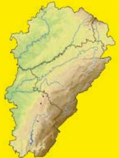
← Campanule cervicaire (E. Brugel) Présence par commune (en rouge, après 2000, en bleu, avant) ↑

Et pourtant les efforts des forestiers n'ont pas été inutiles : la banque de graines du sol a permis le retour de la plante dès que son biotope a été remis en lumière. Depuis, une nouvelle population a été redécouverte, mais l'avenir de l'espèce, aujourd'hui considérée comme vulnérable, ne repose que sur la pérennité du biotope qui abrite deux populations totalisant moins de 1 000 individus.