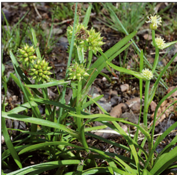
Sparganium minimum Wallroth