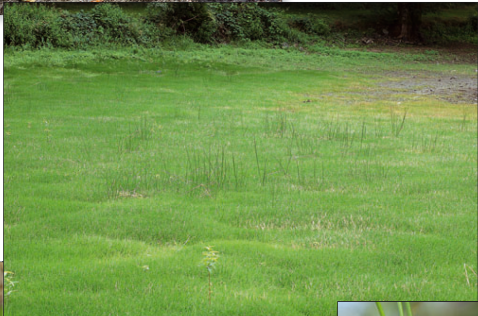
Littorella uniflora (L.) Asch.