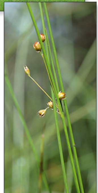
Juncus filiformis L. ▶