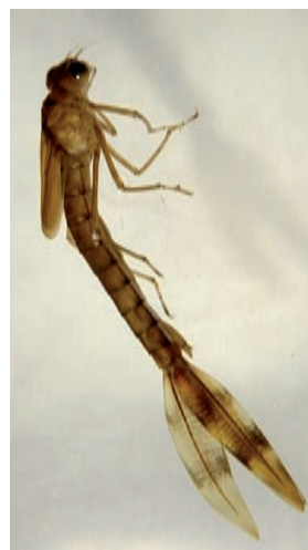
Larve de leste dryade (G. Doucet, 2004)

générations par an. La ponte s'effectue à la base des tiges de carex ou de joncs, même en l'absence d'eau libre, sur des zones qui seront inondées au printemps. L'éclosion des larves aura donc