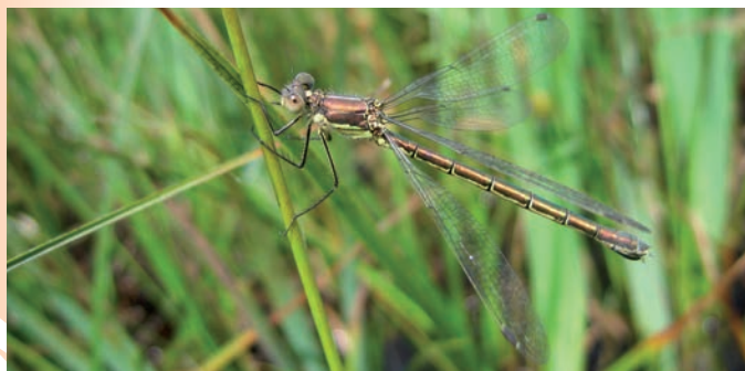
Femelle de leste dryade

A l'instar de celui des autres lestes, le corps du leste dryade ( Lestes dryas ) est vert métallique. Certains de ses segments sont prunieux, dont le deuxième, qui l'est au deux tiers.