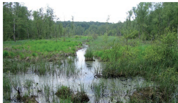
Biotope de leste dryade, eaux stagnantes riches en laiches ( Carex ) et en joncs

Les imagos volent entre mi-juin et mi-août, avec une à deux