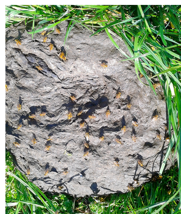
■ La bouse, un micro-écosystème qui sert de gîte et de couvert à de nombreuses espèces...

Enfin, les ingénieurs chimistes assurent la décomposition de la matière organique (formation de l'humus) puis la transformation en éléments assimilables par les plantes, les nitrates (NO 3 - ) par exemple. Les bactéries et les champignons réalisent une grande partie de ce processus, mais les vers de terre ou les collembolles y participent également. Ils se constituent ainsi des complexes argilo-humiques, association intime d'éléments minéraux et d'éléments organiques. Plus ces complexes seront nombreux, plus le sol sera fertile.