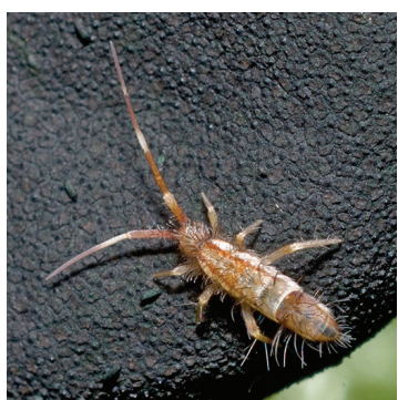
■ Orchesella flavescens © P. & M. Guinchard).

Les collembolles : ils appartiennent au groupe des hexapodes (animaux à 6 pattes) et mesurent entre 0,25 et 4,5 mm. La majorité d'entre eux sont pourvus d'une furca (appendice abdominal) qui leur permet de sauter, notamment pour fuir des prédateurs. Environ 750 espèces sont actuellement connues en France. Beaucoup de collembolles fuient la lumière, c'est pourquoi ils vivent fréquemment dans les premières couches du sol et jusqu'à des profondeurs d'une trentaine de centimètres. Ils se nourrissent de champignons pour la plupart, mais de bactéries, des végétaux décomposés, des excréments... Ils sont donc des acteurs essentiels dans la décomposition de la matière organique. Pour finir, ils sont reconnus pour leur rôle de bio-indicateur, c'est-à-dire qu'ils sont utilisés pour évaluer l'état de santé d'un milieu