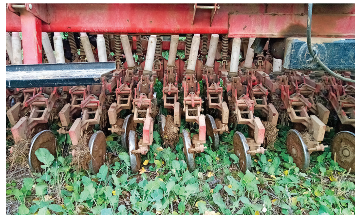
■ Semis du blé sur repousses de colza.

Le semis direct sous couvert permet de préserver la structure du sol et donc l'habitat des vers de terre et de la vie du sol en général. Le couvert végétal, mis