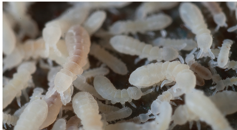
■ Les collembolles, alliés insoupçonnés © P. & M. Guinchard).

L'amendement organique peut donc être une bonne solution pour favoriser la vie du sol, à condition qu'il soit adapté aux caractéristiques du sol (texture, profondeur, pente...), à la période de l'année et ne jamais dépasser les capacités de stockage dans le sol. Le lisier, par exemple, ne doit pas être épandu dans les prairies maigres ou les pelouses sèches, au risque de faire disparaître tout un cortège de plantes adaptées aux sols naturellement pauvres en éléments nutritifs. Enfin, les produits