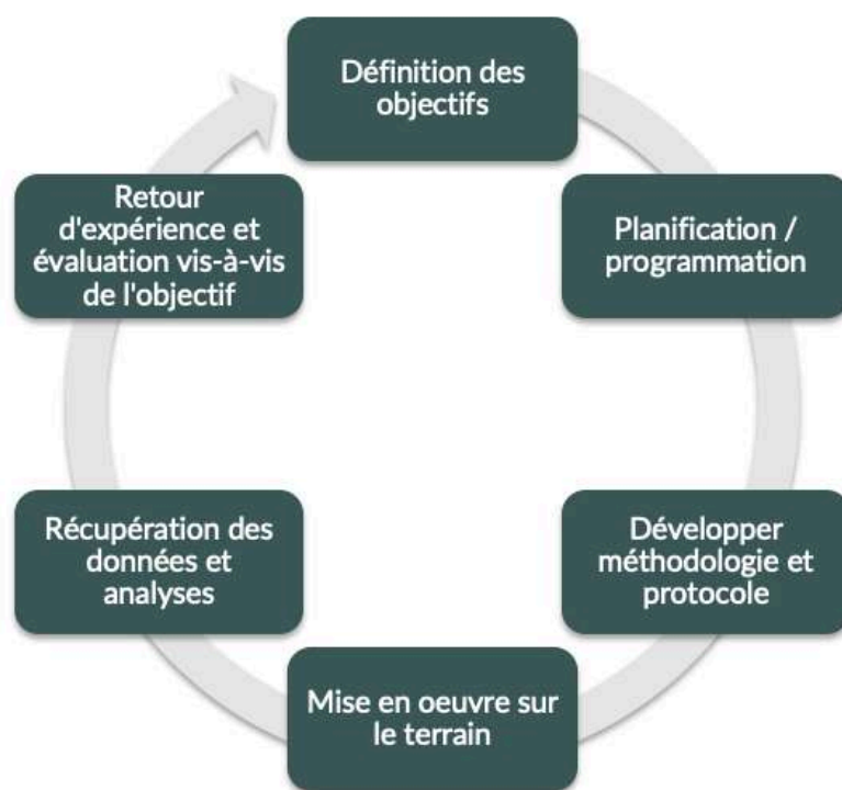
FIGURE N°2 - Les étapes d'un suivi scientifique (d'après Danancher et al., 2016).

N.B. : pour plus de détail sur chacune des étapes discutées ci-après, il est possible de consulter l'ouvrage de Danancher et al. (2016), remarquablement bien fait et traitant de la question « définir, mettre en œuvre et analyser des suivis scientifiques en espaces naturels » dont ce chapitre s'est en grande partie inspiré.