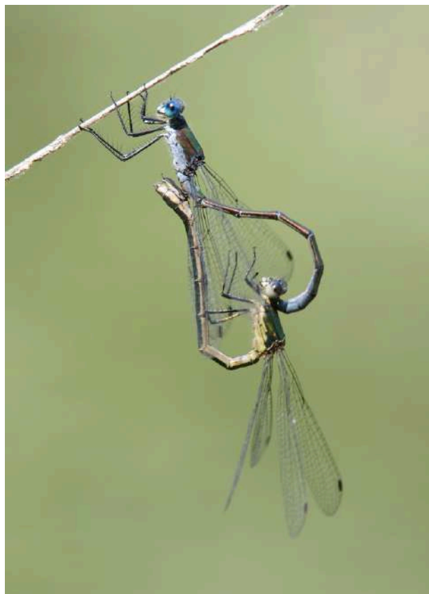
FIGURE N°4 - Lestes dryas fait partie des espèces retenues dans la déclinaison régionale en tant qu'espèce de priorité régionale (M. Poussin).

En raison de la fragilité des populations et du caractère réglementaire lié à certains taxons, ces 26 espèces sont celles qui nécessitent le plus de bénéficier d'actions de suivi des populations en Franche-Comté.