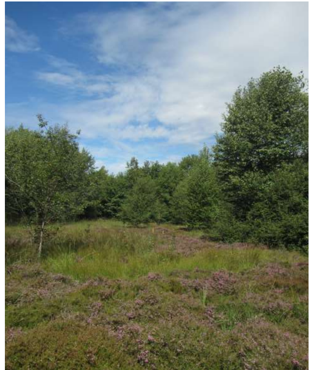
FIGURE N°5 - Les piquets installés pour repérer la station de suivi sont repérables de loin sur cette tourbière.

que, bien que cela soit peu recommandé, la personne en charge du suivi (observateur) ne sera pas toujours la même au cours de sa mise en œuvre. La localisation de la zone à suivre peut être matérialisée par un balisage fixe (piquets en bois ou en métal agrémenté de rubalise à son extrémité ou d'un marquage à la bombe de peinture), un marquage coloré d'éléments fixes du paysage (arbres, rochers...) ou encore en reportant le schéma de la placette ou le tracé des transects sur photographie aérienne.