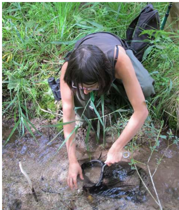
FIGURE N°6 - Recherche de larves de Cordulegaster spp. (G. Doucet).

L'annexe 1 présente les stades phénologiques et indices de présence les plus pertinents à étudier selon les espèces.