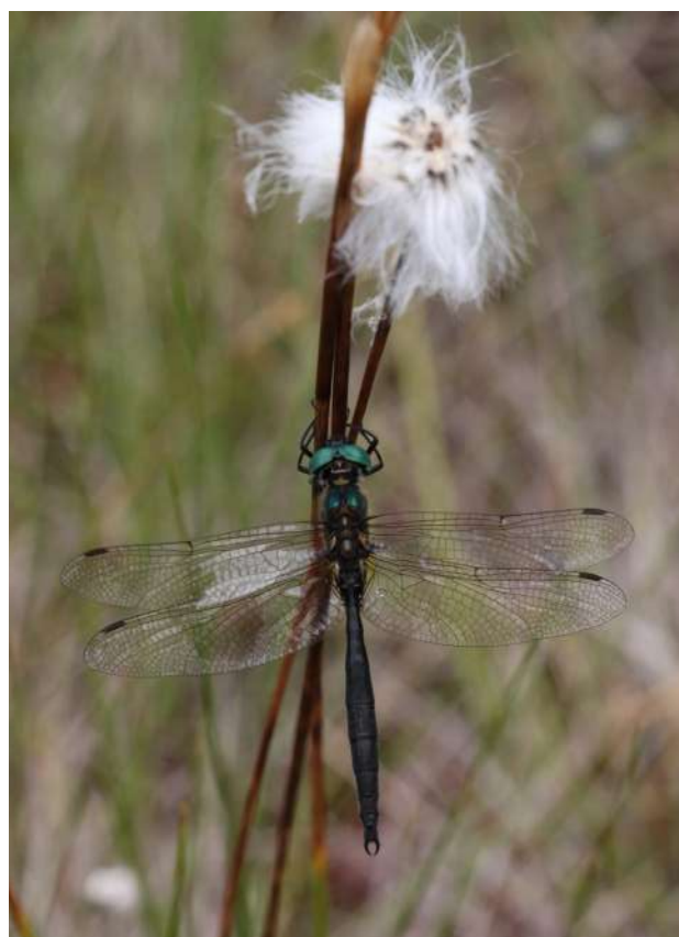
FIGURE N°1 - Malgré son statut régional (« CR » en Bourgogne et « VU » en Franche-Comté), la cordulie arctique ne bénéficie pas à l'heure actuelle d'un suivi régional standardisé de ses populations.

Ce document vise à répertorier les éléments indispensables à ne pas oublier lors de l'élaboration d'un protocole de suivi relatif aux Odonates et plus particulièrement des espèces patrimoniales.