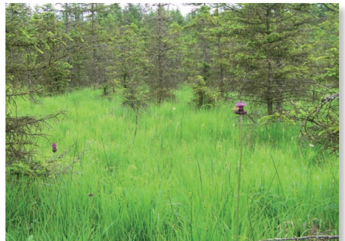
Station du mélibée dans le Doubs potentiellement menacée par l'enrésinement