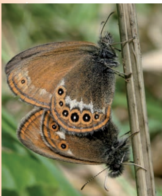
Accouplement de mélibées

Le mélibée fréquente essentiellement les faciès herbacés humides et ouverts (prairies humides, zones marécageuses, ourlets de tourbières...). Toutefois, l'espèce se rencontre occasionnellement sur des clairières, des ripisylves, des coupes forestières ou des prairies sèches. En Franche-Comté, il occupe des moliniaies en lisière de forêt ou dans des coupes forestières.