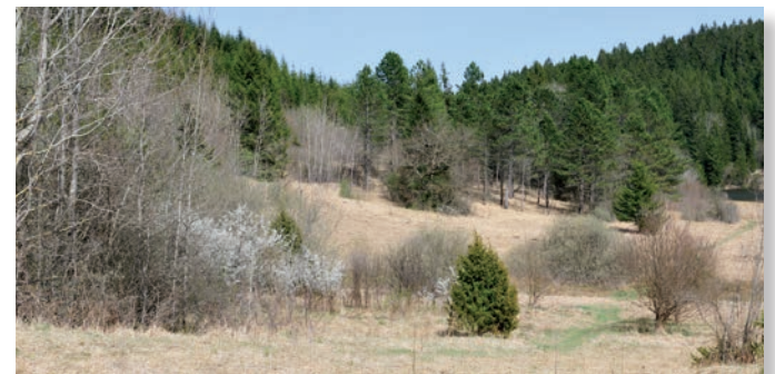
Une moliniaie du premier plateau du Doubs, biotope du mélibée en Franche-Comté

et l'orge d'Europe ( Hordelymus europaeus ) constitue une plante-hôte classiquement citée. Néanmoins, en Franche-Comté, la ponte se fait sans doute sur la molinie bleue ( Molinia caerulea ), espèce dominante des milieux qu'il occupe. Les chenilles sont très difficiles à repérer parmi les herbacées car elles sont vert clair avec des lignes plus foncées sur le dos et les flancs. Elles se nourrissent activement durant toute la belle saison pour ensuite entrer en phase de léthargie hivernale. Le cycle s'achève alors l'année suivante avec la nymphose qui a lieu sur une tige. La chrysalide vert vif est suspendue sur ce support, à quelques centimètres au-dessus du sol.