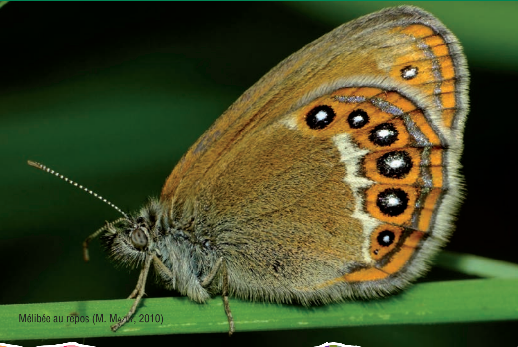
Mélibée au repos (M. MAZU, 2010)