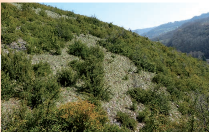
Biotope favorable au mercure sur la RN Côte de Mancy

L'espèce est liée à des milieux herbacés chauds et piquetés de faciès d'enrichissement. Elle se réfugie en effet fréquemment durant la journée au pied des buissons où ses chenilles trouvent par ailleurs une herbe plus haute au début de leur développement.