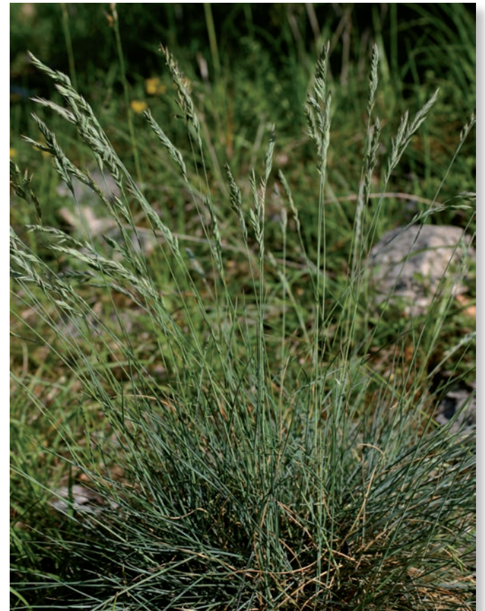
Fétuque du groupe ovina ( Festuca longifolia subsp. pseudocoste ), une des plantes-hôtes du mercure (C. HENNEQUIN, 2009)

Les œufs ne sont pas fixés et la femelle les laisse tomber au vol un à un dans la végétation. La chenille finit sa croissance fin juin ou début juillet après avoir hiverné au premier stade. Les fétuques du groupe ovina semblent être les plantes-hôtes principales de ce papillon. Les imagos volent principalement en août.