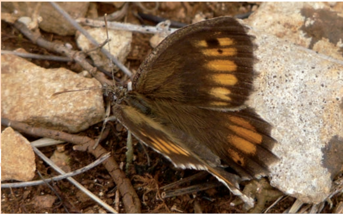
Mercure à Chenôve en Côte-d'Or (21), vue supérieure (C. VOINOT, 2009)

Le mercure est brun foncé sur le dessus avec une tache post-discale fauve et dentée. Sur le dessous, il est gris-brun avec une bande post-discale noire. Chez la femelle, les dessins fauves sont plus larges que chez le mâle. La discrétion de cette espèce rend sa détection difficile. En vol, le mercure peut être confondu avec le myrtil ( Manioliá jurтина ).