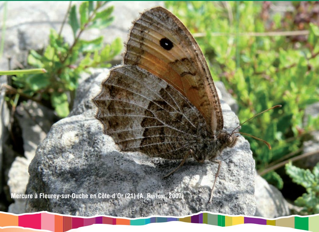
Mercure à Fleurey-sur-Ouche en Côte-d'Or (21) (A. RUFFONI, 2007)